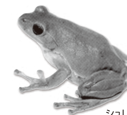
シュレーゲルアオガエル

長野県のほぼ中央、諏訪湖の北東に位置する霧ヶ峰高原の八島湿原にある町立のビジターセンターです。国の文化財である八島ヶ原湿原の生い立ちをわかりやすく説明した館内展示や四季折々の映像を通して八島湿原を中心とした地域の最新情報をお届けしています。