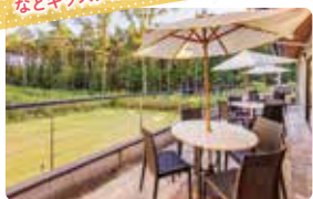
お子様ランチやお子様サラダバー などキッズメニューも充実！