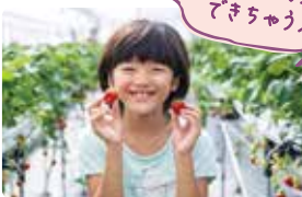
7年中いちご狩りが できちゃう！