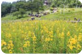
色とりどりの山野草 【入笠湿原】