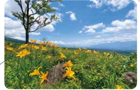
150種の野草が咲き誇る草原 【創造の森 望峰の丘】