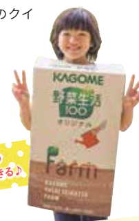
大きなパッケージの 着ぐるみで撮影できるよ！

☎0266-78-3935 ㉑富士見町富士見9275-1 【営】10:30~16:00 【休】冬季休館(12月中旬~3月下旬) 火曜定休の他、臨時休館あり。