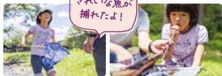
きれいな魚が 捕れたよ！

☎0266-75-2554 ㉑富士見町落合13505-1 【営】10:00~16:00(火曜定休) ※季節により変動あり