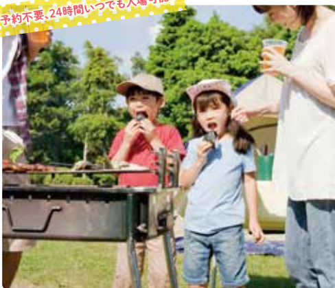
予約不要、24時間いつでも入場可能！