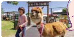
見つけたら ハッピー！ ハートのアルパカ を探そう！