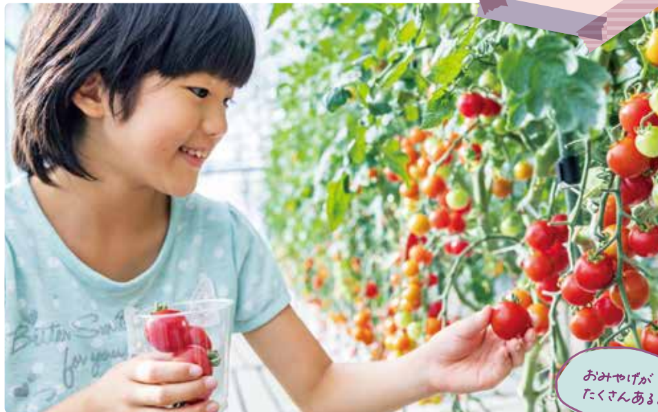
おみやげが たくさんあるよ！