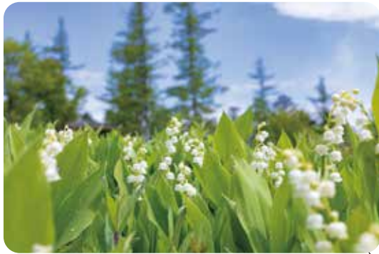
120万本のすずらん群生 【入笠山】 開花時期 5月～6月