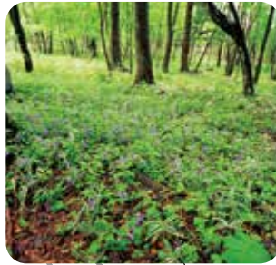
ふじみ 分水の森 自然の林の 中の散策路。 四季の花も 楽しめます。