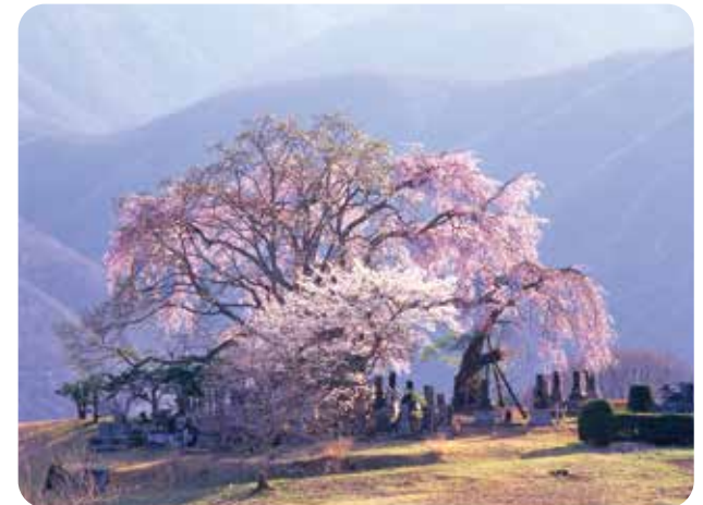
しだれ桜 【田端】 開花時期 4月

富士見町はまち全体が花の楽園。まちを散策すればそこかしこで季節ごとの花が彩る美しい情景に出逢うことができます。里に春の訪れを告げる梅・桃・桜の開花から5月を迎えるといよいよ本番。町内屈指の花の名所である富士見高原リゾートや富士見パノラマリゾート、入笠山を中心として、淡く輝く新緑の舞台に多くの野草や高山植物、園芸品種の花たちがその彩りと個性を競うように華やかに咲き誇ります。さらに富士見町では世界でもここで見ることのできない葎無ホテイアツモリソウの他、イチヨウランや縄文時代の種から発芽した大賀ハス(古代ハス)などの稀少な花々を始め、120万株以上の白く可憐な花が高原一面を埋め尽くすすずらんの大群生や一面を橙色に染め上げるニッコウキスゲの群生など、その季節にしか出逢えない花のシーンが満載。