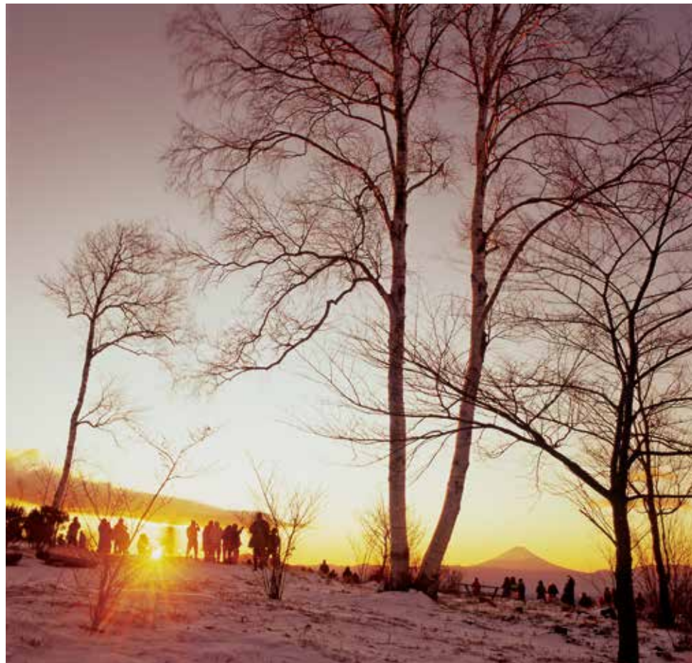
富士見高原リゾート・創造の森では毎年恒例の「初日の出りフト」が運行され、300~400人の人々が初日の出と富士山の絶景を楽しみに訪れます。この日の初日の出も天候に恵まれ、素晴らしい初日の出となりました。長野県富士見町は県内随一の初日の出ビュースポットです。(撮影メモ)

故郷はいつも君の心の中に。 故郷とは「力」なり。 写真家がその四季の美を追い、 撮りつづけたいと願ったまち。 四季ごと、時間ごと、その表情が豊かに移り変わる富士見町の景観は、そのすべてが絶好の写真的題材。特に富士山から南アルプス、北アルプスまでを一望できる「創造の森 彫刻公園」、八ヶ岳のダイナミックな裾野を前景に富士山の雄姿を望む「立沢の水田地帯」、中央高速自動車道を通る車のテールランプが夕景に映える「葛窪・中央道トンネル」からの富士山は「関東の富士見百景」に選出された町内屈指のスポットです。旅の途中でふと出逢った貴重な一瞬を逃すことのないように、富士見町を訪れる時はいつもお手元カメラをお忘れなく。