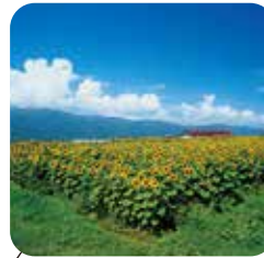
ひまわり畑 【立沢羽場】 開花時期 7月～8月