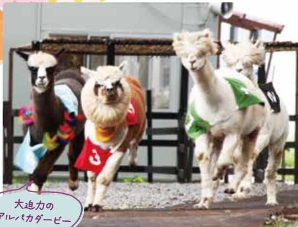
大迫力の アルパカダービー