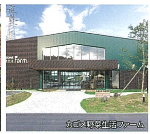
カゴメ野菜生活ファーム