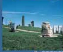
美ヶ原原野美術館