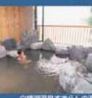
白樺湖温泉すずらの湯