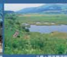
八島ヶ原高原温泉