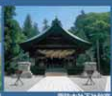
諏訪大社下社秋宮