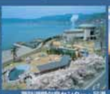
諏訪湖観光センター・空湯