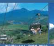
車山登山リフト・白樺湖・豊科山