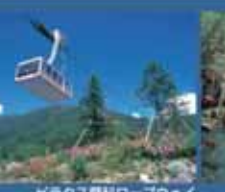
ピラタス豊科ロープウェイ