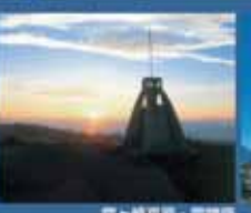
霧ヶ峰高原・霧峰町