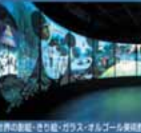
世界の巻紙・せり紙・ガラス・オルゴール美術館