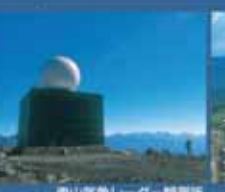
車山麓スキーセンター