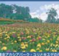
美達アスカパーク・ユリとキスグの丘